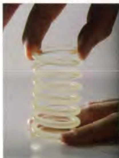
Un ressort en résine pour démontrer rapidement la fonctionnalité d'une pièce