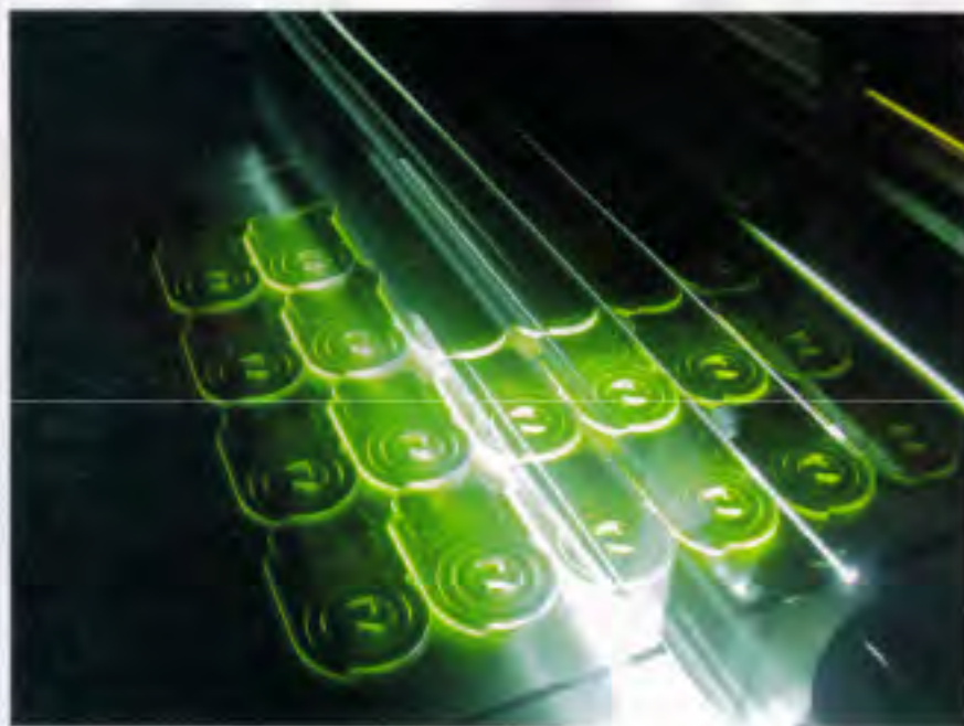
De la résine pour créer des formes de toutes pièces

Fondée en juin 2005 à La Neuveville, la société Zedax a pour ambition de réaliser des prototypes en résine dans un délai très court (à partir de 48 heures !). Ses services s'étendent à l'ensemble des domaines liés à l'impression 3D : modélisation informatique, scan 3D, fabrication et valorisation des prototypes.