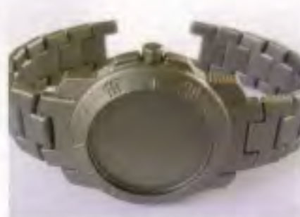
Une montre ainsi que son bracelet. Particularité de ce dernier, ce procédé de prototypage rapide permet de créer des bracelets déjà assemblés